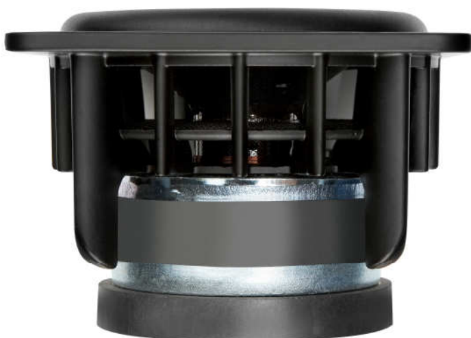
bashøjtaleren SA W1104XL: