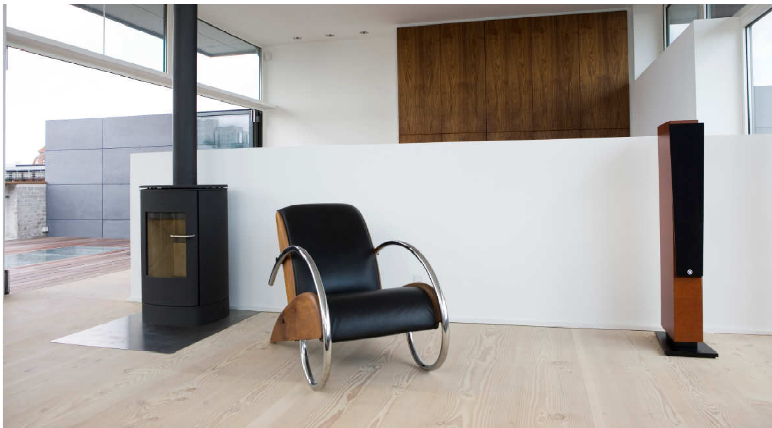
SA ranger er mere end en topklasse højttaler. Den er et smukt møbel