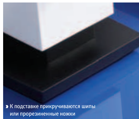
► К подставке прикручиваются шипы или прорезиненные ножки