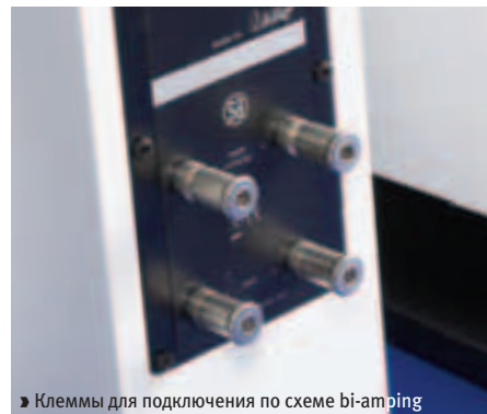
► Клеммы для подключения по схеме bi-amping